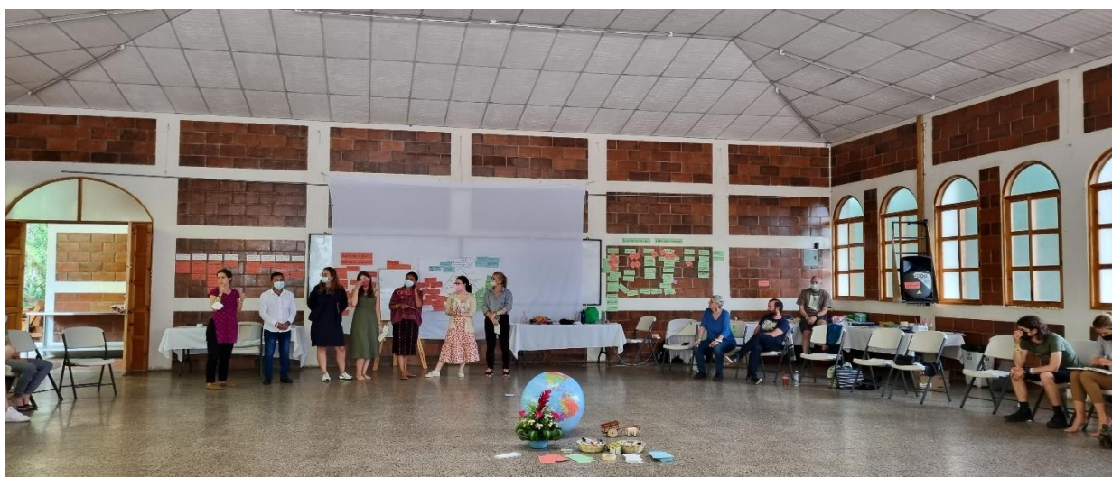
Intercambio de jóvenes defensoras/es de los recursos naturales y promotores para la adaptación ante los efectos del cambio climático en Huehuetenango