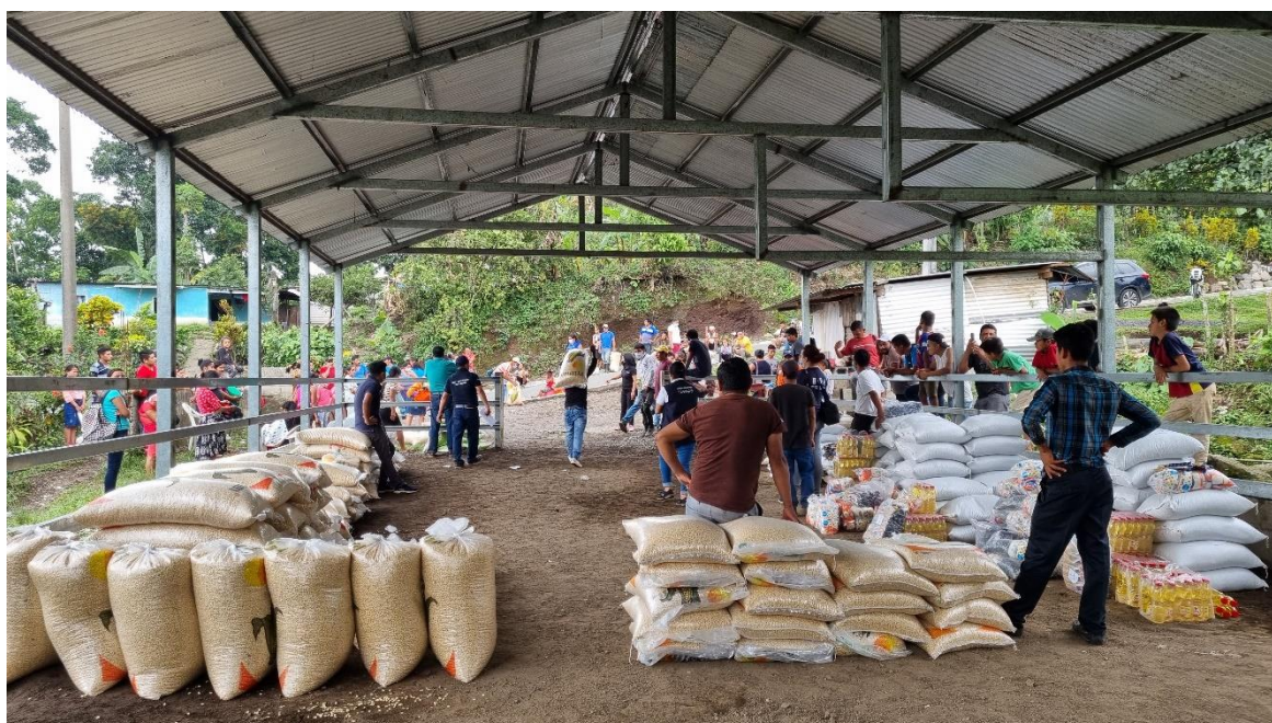
Proyecto de inseguridad alimentaria por las erupciones del volcán de fuego en las comunidades afectadas.