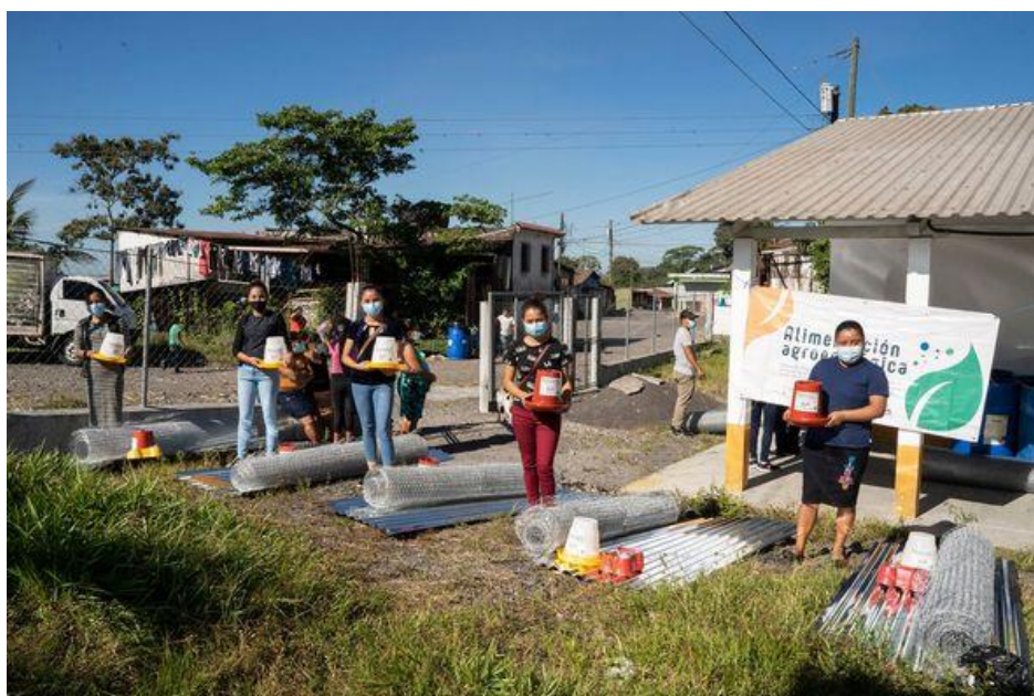
Entrega de insumos en comunidades del volcán de Fuego para la implementación de granjas familiares