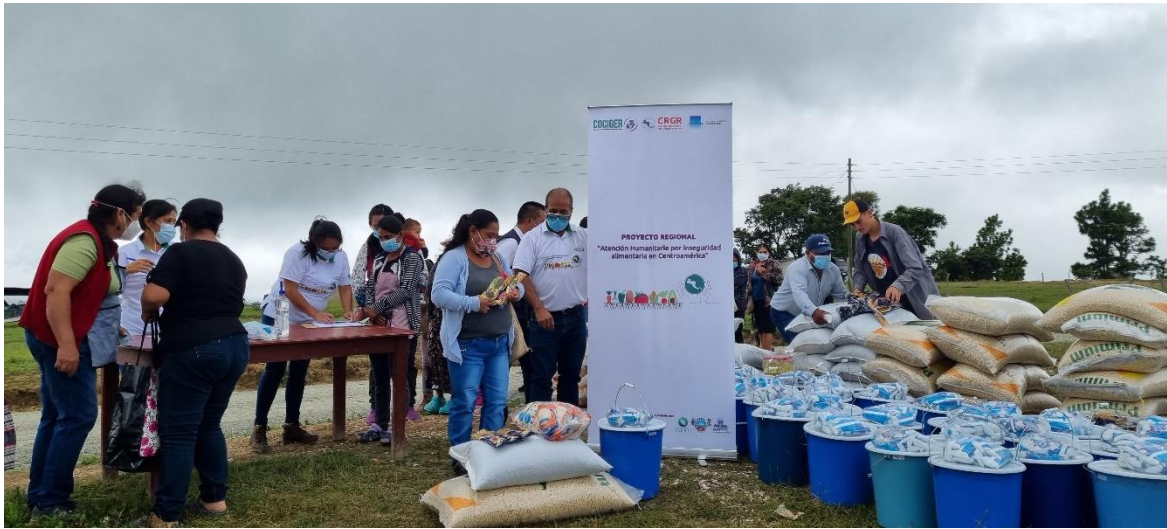
Proyecto de Seguridad Alimentaria, por las consecuencias de la sequía en el corredor seco, enfocado en el municipio de Malacatancito, Departamento de Huehuetenango, dirigido a grupos de mujeres y campesinos.