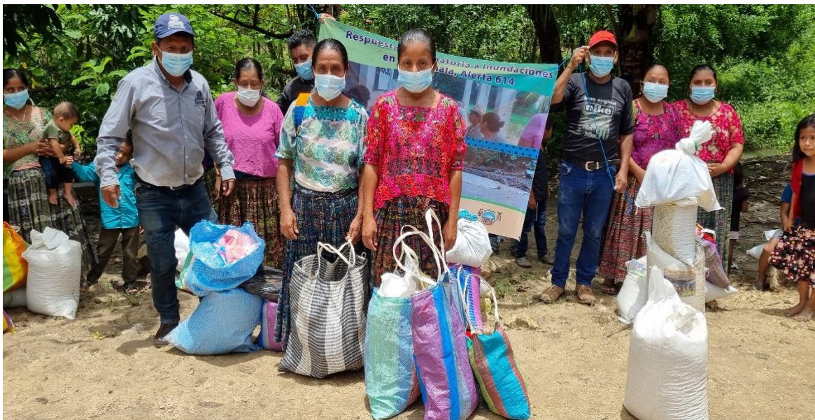
Ejecución del proyecto por las tormentas, en los municipios de Chisec y Municipio de Carchá en el Departamento de Alta Verapaz, apoyando a más de 21 comunidades que han tenido pérdida de sus cultivos, viviendas y bienes personales.