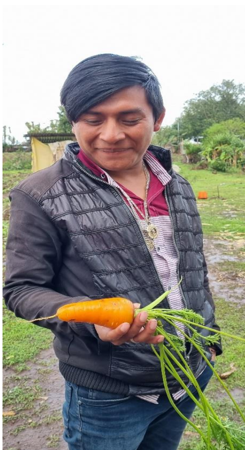
Proyectos de Adaptación al Cambio Climático en municipios San Ildefonso Ixtahuacán, Aguacatán, Santa Bárbara enfocado a Grupos de Mujeres, Grupos de Jóvenes quienes aportar con acciones del cuidado del medio ambiente, huertos familiares, el monitoreo del tiempo por medio de las Estaciones climáticas.