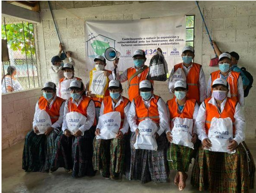
COLRED de Agua Subterránea, organizada, capacitada y acreditada ante la SE CONRED y el gobierno municipal de Chisec.